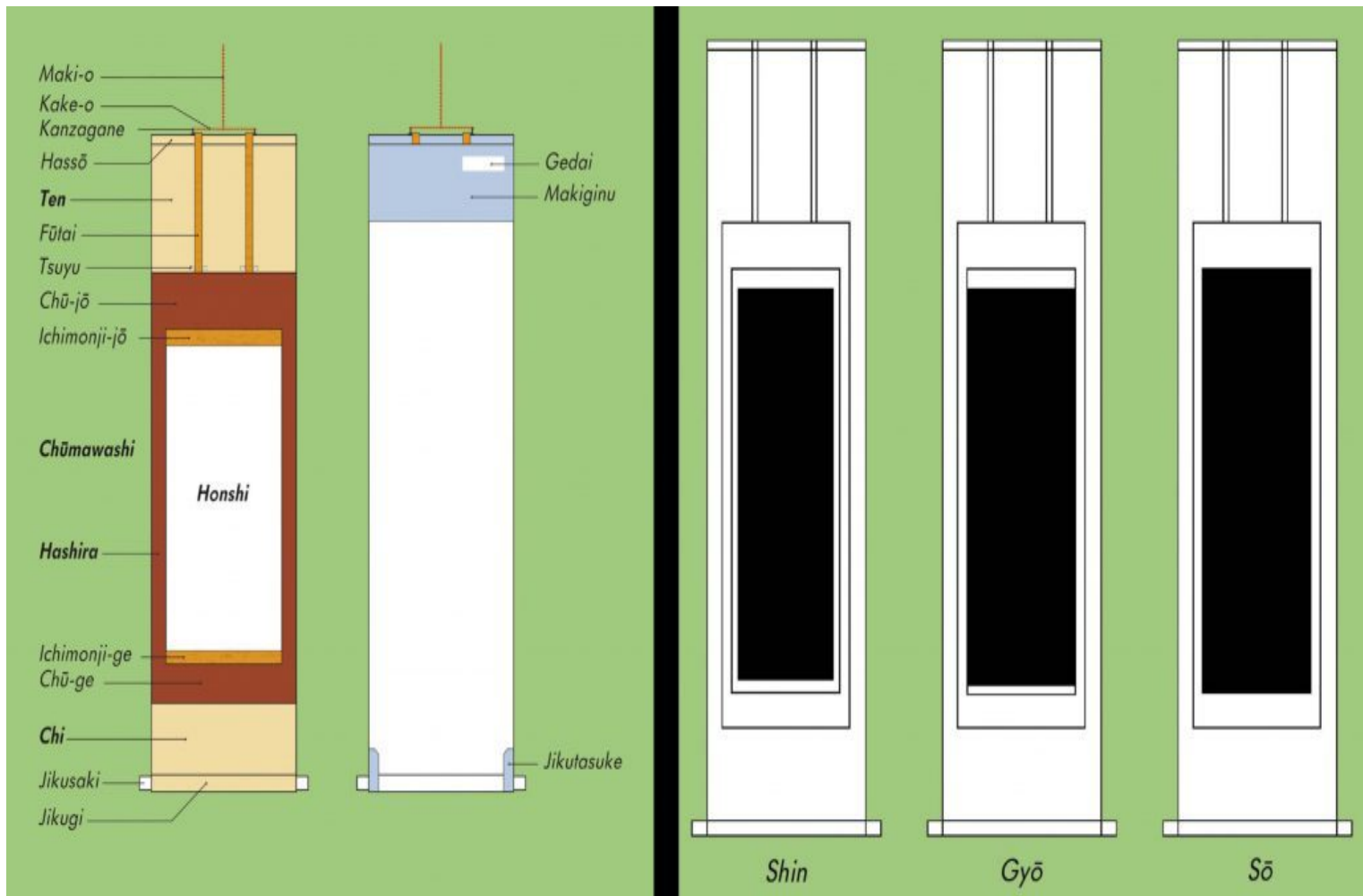
Diagrama mostrando los nombres de las partes que componen un kakemono (izquierda). Subtipos de kakemono según su carácter (Derecha).