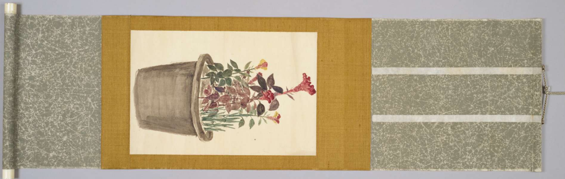
【鶏頭の図】 1軸 WB41-56 01-002